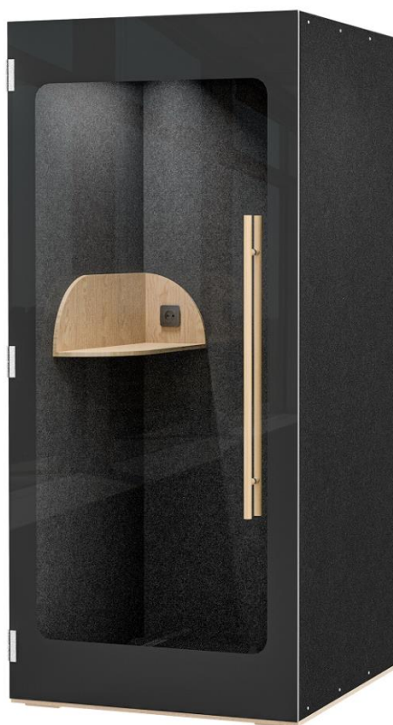
Rysunek 5.1 – 1-osobowa budka telefoniczna HIDE BOOTH